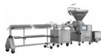
↑ PLSH 217 avec « Suspension »