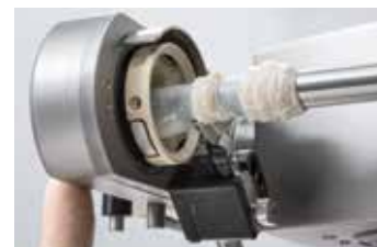
↑ Capteur d'extrémité de boyau

Le principe de séparation des saucisses en bande par lame synchronisée garantit des portions clairement séparées avec des extrémités de boyaux fermées. Cette fiabilité garantit une production sûre et ininterrompue. La découpage individuelle offre une large possibilité d'applications allant des produits frais à la saucisse crue pour un temps court d'installation.